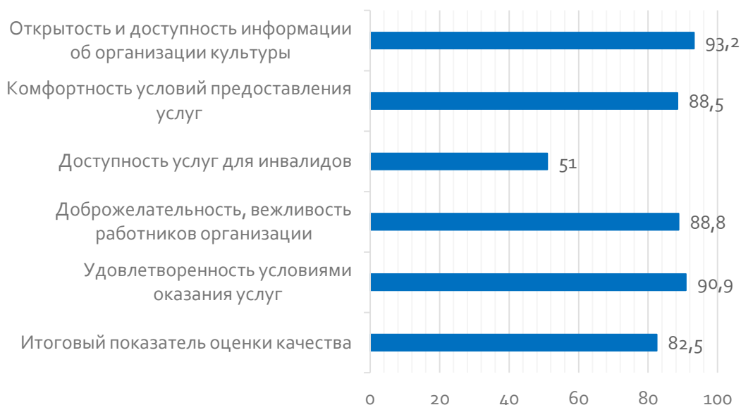
Рис. 1. Показатели оценки качества условий оказания услуг МБУК «Касторенский центр досуга и кино «Родина» в 2021 году, баллы

Значения рассчитанных показателей оценки качества условий оказания услуг МБУК «Касторенский центр досуга и кино «Родина» проиллюстрированы на рисунке 1.